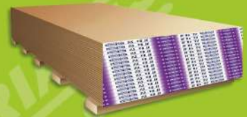
Panel Ceiling Rey