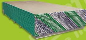
Panel Water Rey