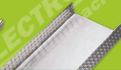
Canal de Amarre