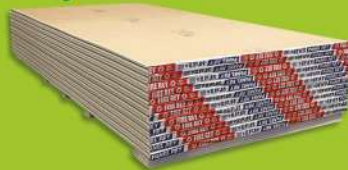
Panel Fire Rey C