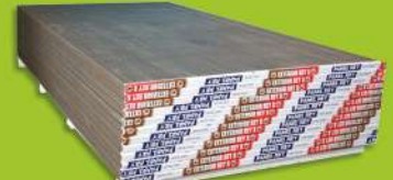
Panel Exterior Rey X