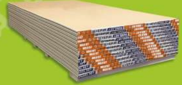
Panel Mold Rey X