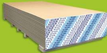
Panel Regular y Light