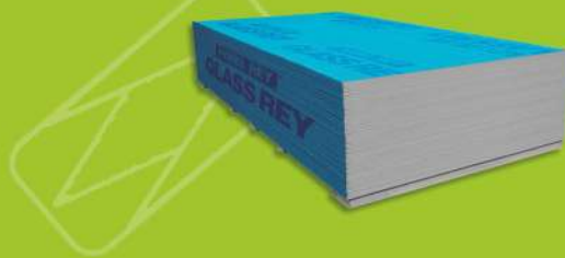
Panel Glass Rey